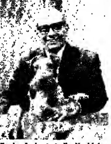
Terrier Jacky trat die Nachfolge des ersten Fernseh Hundes Struppi an der Seite von Robert Lembke an

von Produktionen, die ich gerne noch einmal gesehen hätte. Von Anfang an fiel mir auf, daß die Reaktion auf Kommentare und andere politische Meinungsäußerungen wesentlich heftiger war als im Hörfunk.